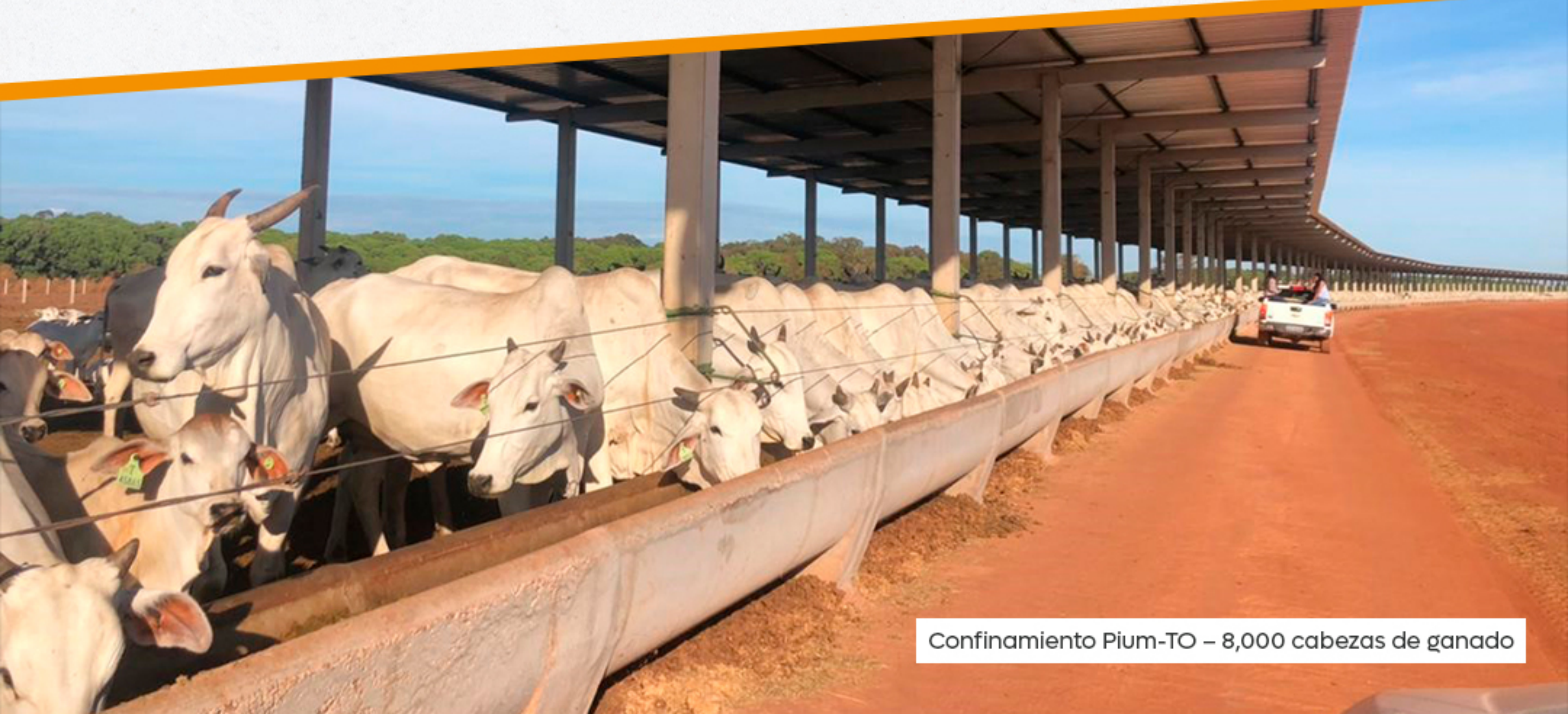
Confinamiento Pium-TO – 8,000 cabezas de ganado

“Creada en 2005, Alcance Consultoria e Planejamento Rural tiene como objetivo prestar servicios de consultoría agrícola haciendo sus clientes más competitivos en sus actividades.”