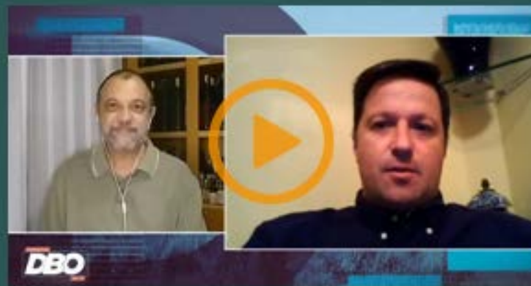
• Entrevista Tiago Felipini para o Terra Viva/Rede Bandeirantes Programa DBO na TV