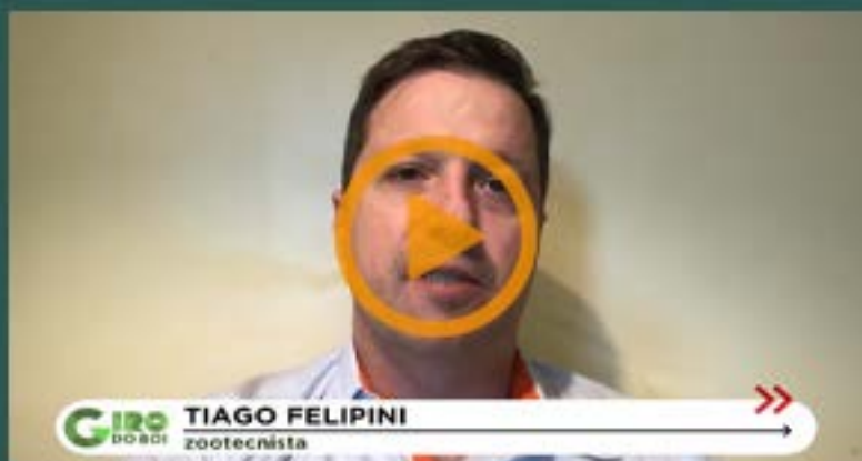
• Recomendações para o Canal Rural - Programa Giro do Boi Responde